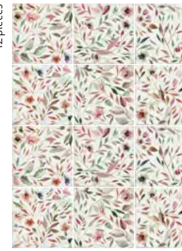
37815 MAYOLICA GARDEN/15X15 Q54 (14,8x14,8 cm — 5 13 / 16 x5 13 / 16 "*) 10 patterns * 103 Mapei