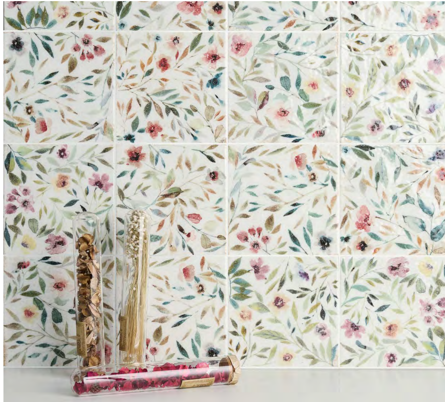
● MAYOLICA GARDEN/15X15