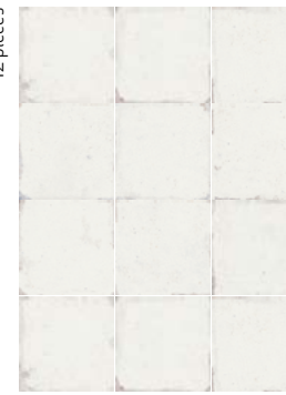
37814 MAYOLICA PLAIN/15X15 Q54 (14,8x14,8 cm — 5 13 / 16 x5 13 / 16 "*) 10 patterns * 103 Mapei