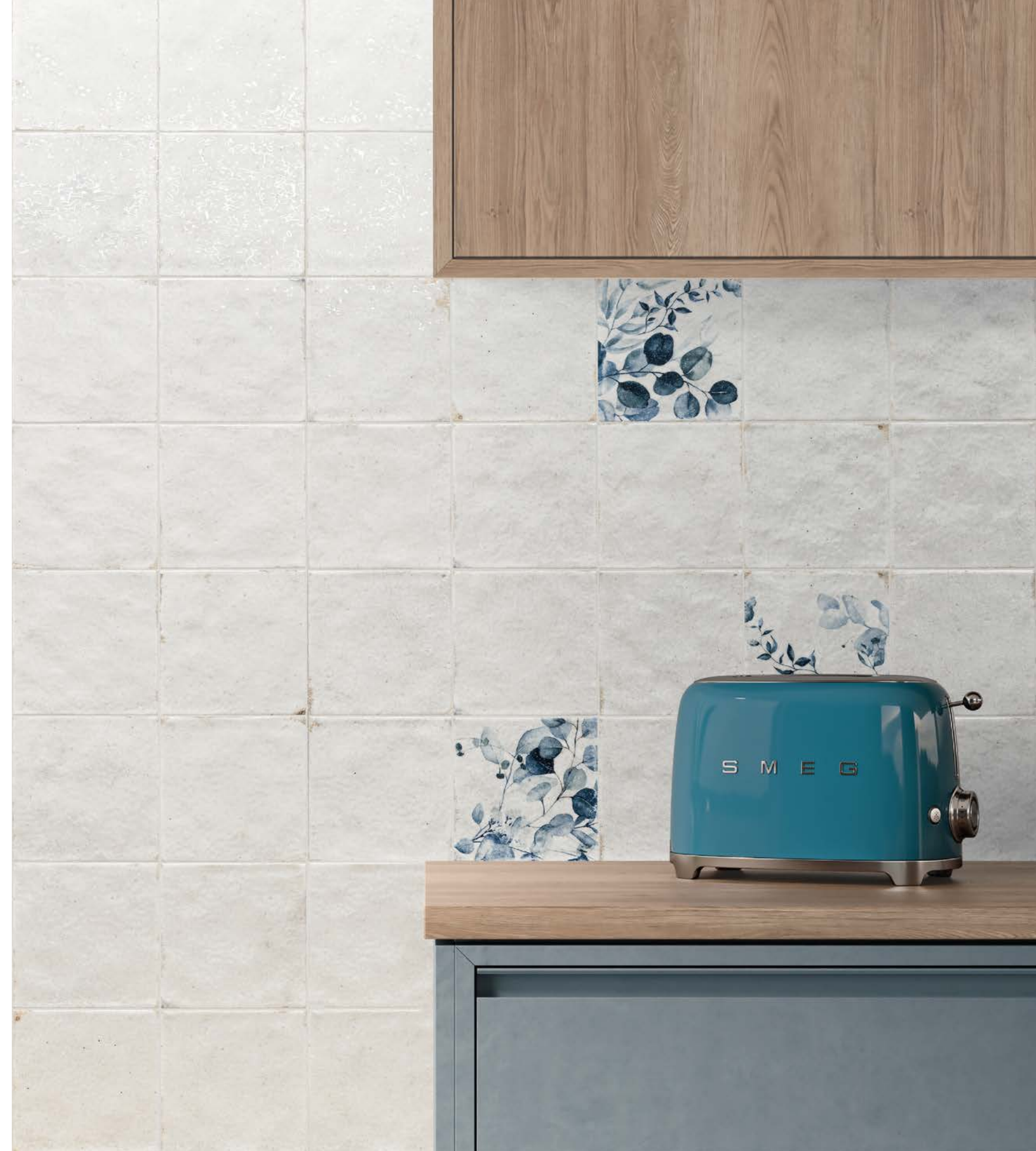
● MAYOLICA WOODS/15X15 · MAYOLICA PLAIN/15X15