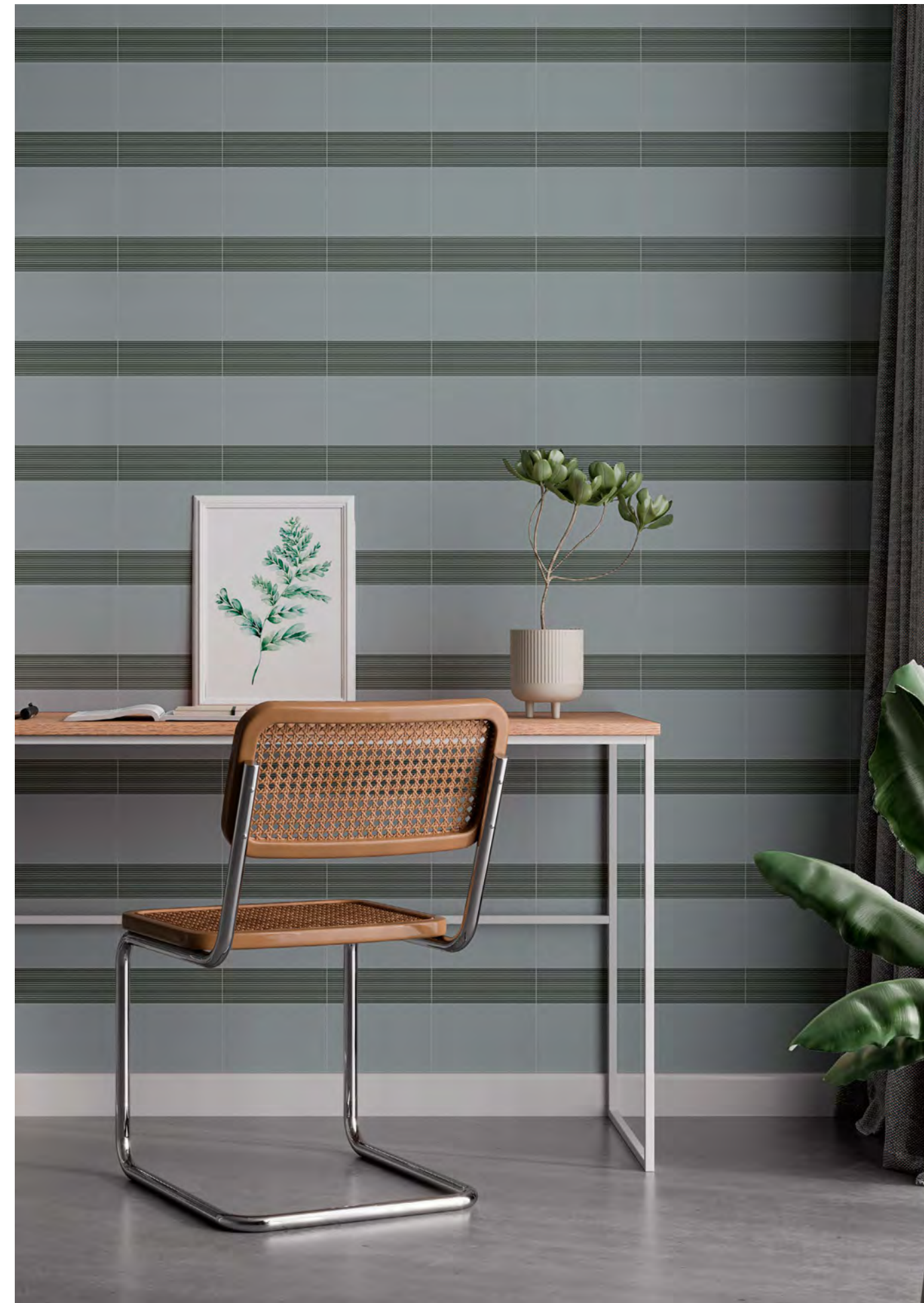
TONAL SAGE 1/20

Raw Color firma en exclusiva para HARMONY la colección TONAL, inspirada en la proporción y la consecución de patrones. Tres referencias independientes por color que permiten diseñar espacios únicos, y que también funcionan combinándolos entre sí de forma random. Colores de tendencia que acompañan a la geometría de la colección.