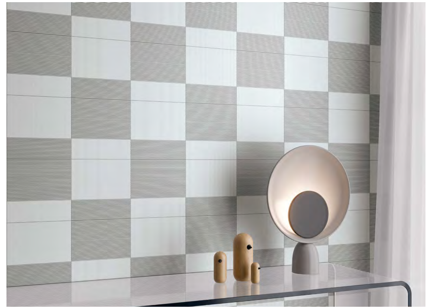
TONAL WHITE 1/20 · TONAL WHITE 2/20