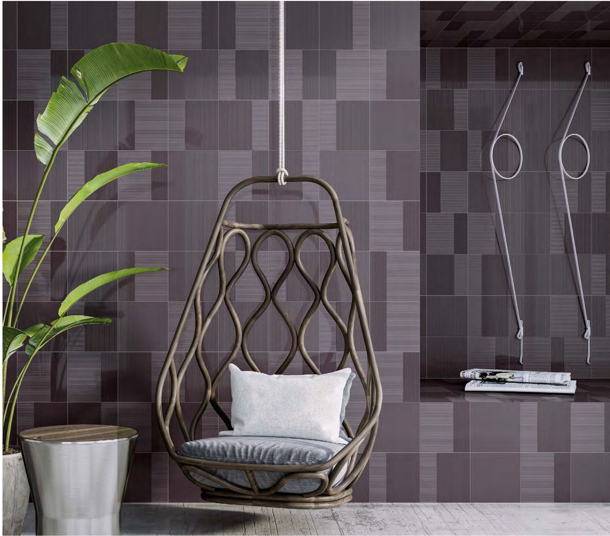
TONAL AUBERGINE 1/20 · TONAL AUBERGINE 2/20 · TONAL AUBERGINE 3/20